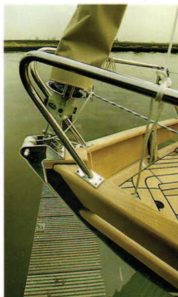
Een lange rvs-strip op de boeg vormt de putting voor het voorstag. Twee rolletjes geleiden de ankerlijn.

dig. Weliswaar ontwaarden we een paar initiatieven zoals de nog altijd wonderschoon getuigde Brendan (Zeilen 00-2). Een deel van deze nieuwe markt viel voor het concept van de chique dagzeiler, van open boten als de Focus (zie Zeilen 01-3) tot semi-kajuitzeilboten als de J/100 (Zeilen 05-6), de Alerion (Zeilen 00-10) of de Romily (Zeilen 03-11), maar geen van allen brak tot nu toe echt door. Al deze boten zijn