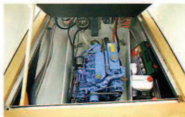
De motor is prima bereikbaar via een ruim luik in de kuipvloer.

Een voorjaarsmiddag op de Marina 85 is met een borreltje nog gerieflijker.