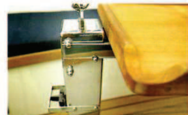
De rvs pijp waarop de grootschoot bevestigd is, vormt ook de steun voor de kuiptafel. Naar wens kan de kuiptafel naar achteren ingehaakt worden (zie foto) of naar voren.