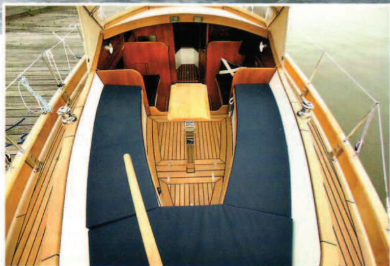
De grote kuip geeft toegang tot een open salon die in de haven overdekt kan worden door een kuintent.

Een voorjaarsmiddag op de Marina 85 is met een borreltje nog gerieflijker.