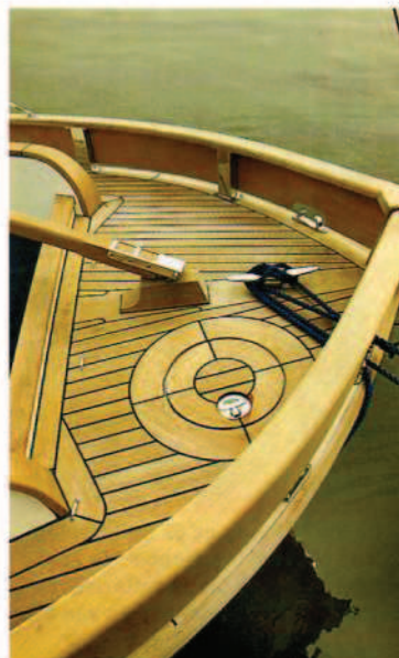
Overzicht over het achterdekje met helmstok, roerkoning en gasbun.