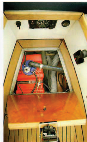
De dieseltank bevindt zich onder het luik achterin de kuip.